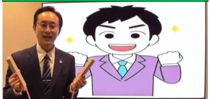
青葉法律事務所 弁護士 中小企業診断士