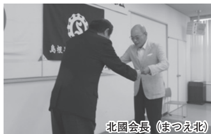
北國会長 (まつえ北)